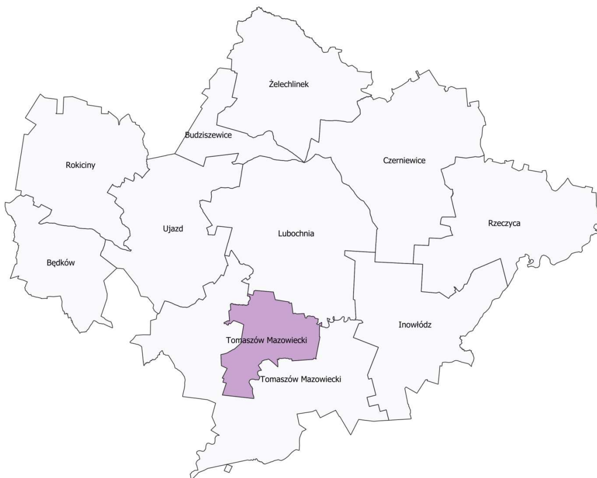
Rysunek 1. Miasto Tomaszów Mazowiecki na tle powiatu tomaszowskiego.